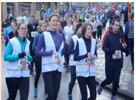
Corrida de Leuven