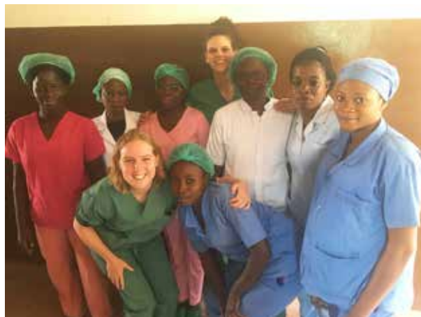
Après des semaines de travail intense ensemble, l'au-revoir devient difficile. Nous remercions les collaborateurs pour leur collégialité et pour leurs soins pendant ma maladie.