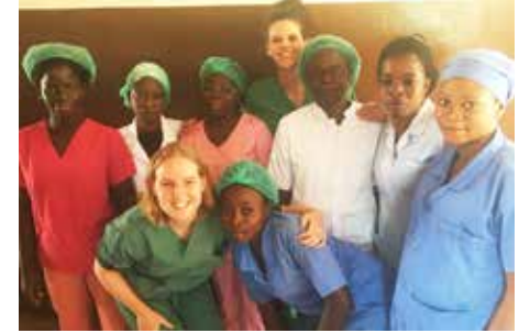
Stage d'étudiantes en médecine 2