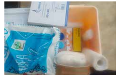
La santé en milieu scolaire 3