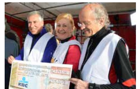
Corrida de fin d'année à Leuven 4