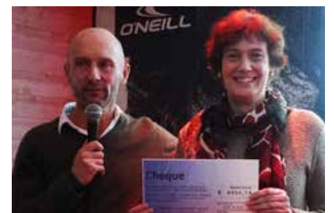
La Fondation sous la loupe 4

Une alimentation saine est l'investissement ultime pour l'Afrique.