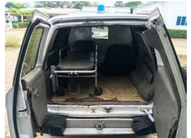
Droite : Nous nous aidons du matériel mis à notre disposition. Voici l'ambulance. Elle permet le transport d'une maman et de son enfant ainsi qu'une bouteille d'oxygène surdimensionnée (50 kg). Nous étions assis à 3 sur la banquette avant : la grand-mère de l'enfant sur mes genoux.