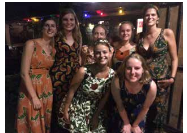
Les derniers jours de notre séjour, nous avons recherché le contact de nos compagnons d'études qui menaient leur stage d'études à l'hôpital universitaire de Cotonou. Nous avons fêté Noël en tenues locales !