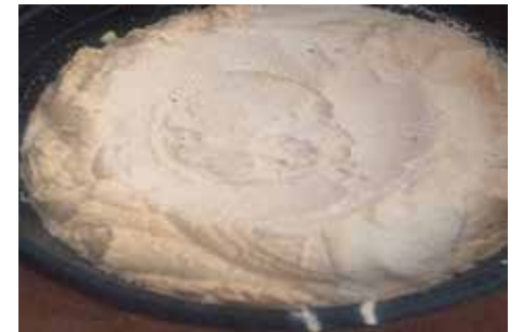
Habitudes alimentaires dans le nord du Bénin 3