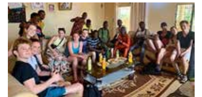
L'école supérieure Odisee en voyage d'immersion au Bénin 3