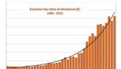
Rapport Financier 2021 4

La Fondation Hubi & Vinciane sous la loupe