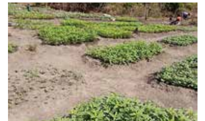
Les premiers potagers communs sont presque prêts 3