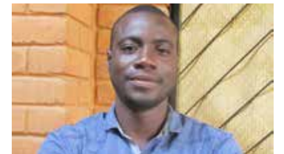
Chams-dine : un poème pour les volontaires et bénévoles de la Belgique 3