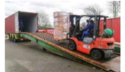
La Fondation et Wereld Missie Hulp, un partenariat unique 3