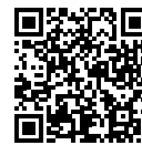
Dépenses Fondation Hubi & Vinciane - 2021

Vous trouverez un rapport financier détaillé sur notre site web.