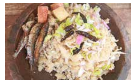
Gestampde, gedroogde en gekruide Yinnou