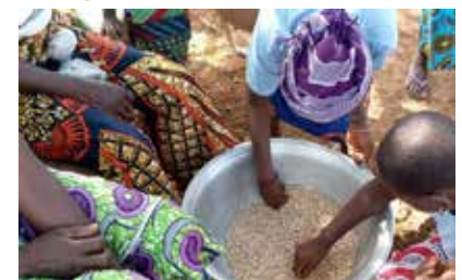
10 februari, Wereld Peulvruchten Dag