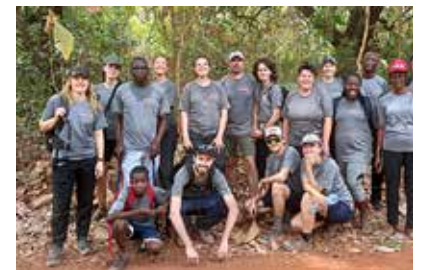
Run for Boko 6 e editie