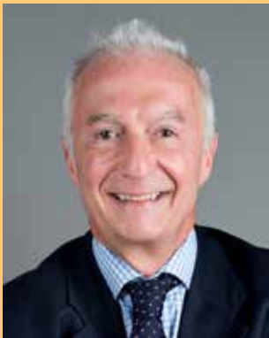
Gilles de Kerchove

Ten tweede omdat de projecten die we samen ontwikkelen - in de domeinen onderwijs, landbouw, gezondheid en ondernemerschap - het best mogelijke antwoord zijn om de opmars van de terroristische groeperingen en hun dodelijke ideologie af te remmen.