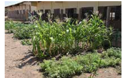
Maïs telen in het droogseizoen!