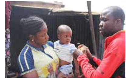
De strijd tegen ondervoeding