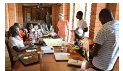
Team building au Bénin sur les objectifs et les valeurs 3