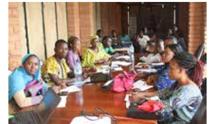
Maladies Non Transmissibles : formation du personnel du projet 2