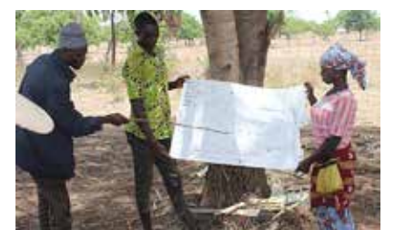
Expérimenter avec Smart valley 3