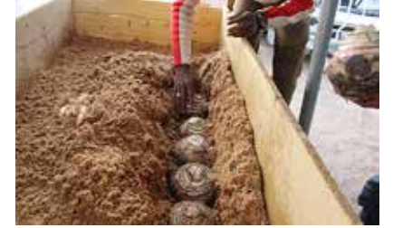
Multiplication de rejets de bananiers sains 2

Les AVEC : un pas en avant vers l'autonomisation économique des femmes pour le développement durable des communautés.