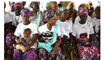
8 mars 2023 : La Journée Mondiale de la Femme 3